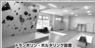
トランポリン・ボルダリング設置